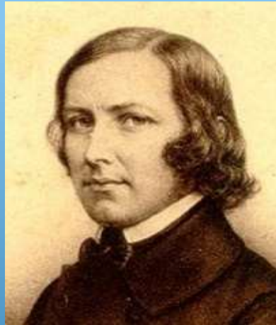
Charles de Montalembert Giornalista, storico, uomo politico francese (1810- 1870)

“Lorsqu’il s’agit des humbles, c’est la liberté qui opprime et la loi qui libère!”